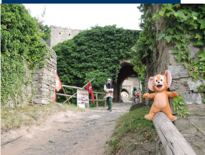
Plyšový Jerry na Hukvaldech

nebo je nám pošlete na mail a my je zveřejníme. Všechny fotky budou vyvěšeny i na stránkách MAS , případně využity v publikacích MAS.