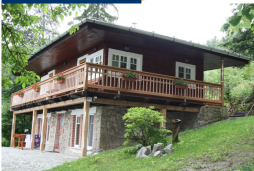
Chata Měsíček na Ostravici

V posledních týdnech byl úspěšně dokončen projekt, který jako jeden