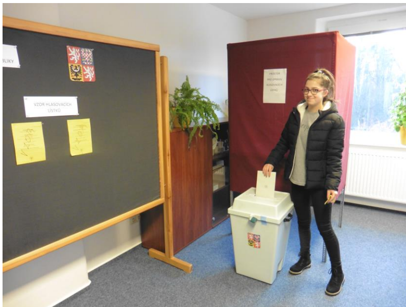
Prvovolička II. kola volby