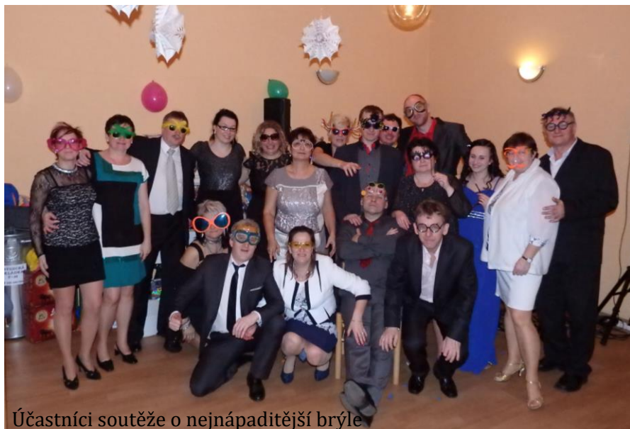
Účastníci soutěže o nejnápaditější brýle

Pořadatelé by tímto chtěli poděkovat sponzorům za dary věnované do tomboly.