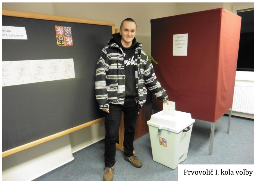
Prvovolič I. kola volby