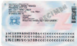
Zadní strana (bez čípu)